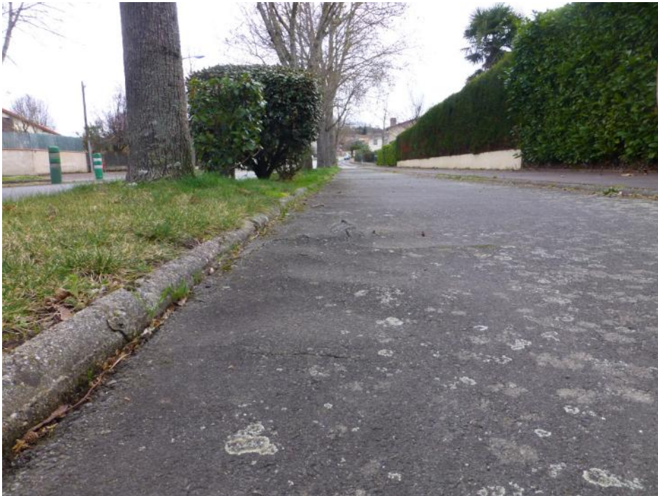
27-Déformation du revêtement