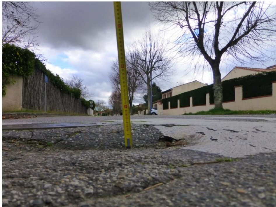
16a-Mesure de la dégradation