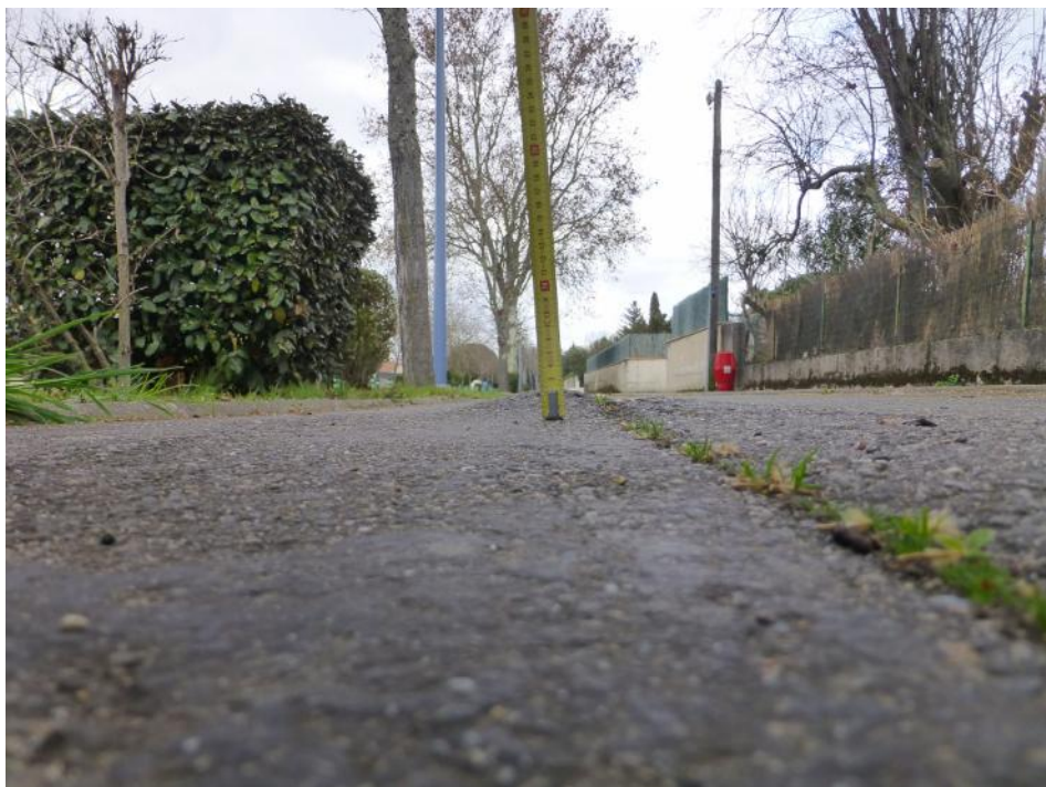
19-Surélévation du revêtement au niveau entre le N° 14 et le N°16