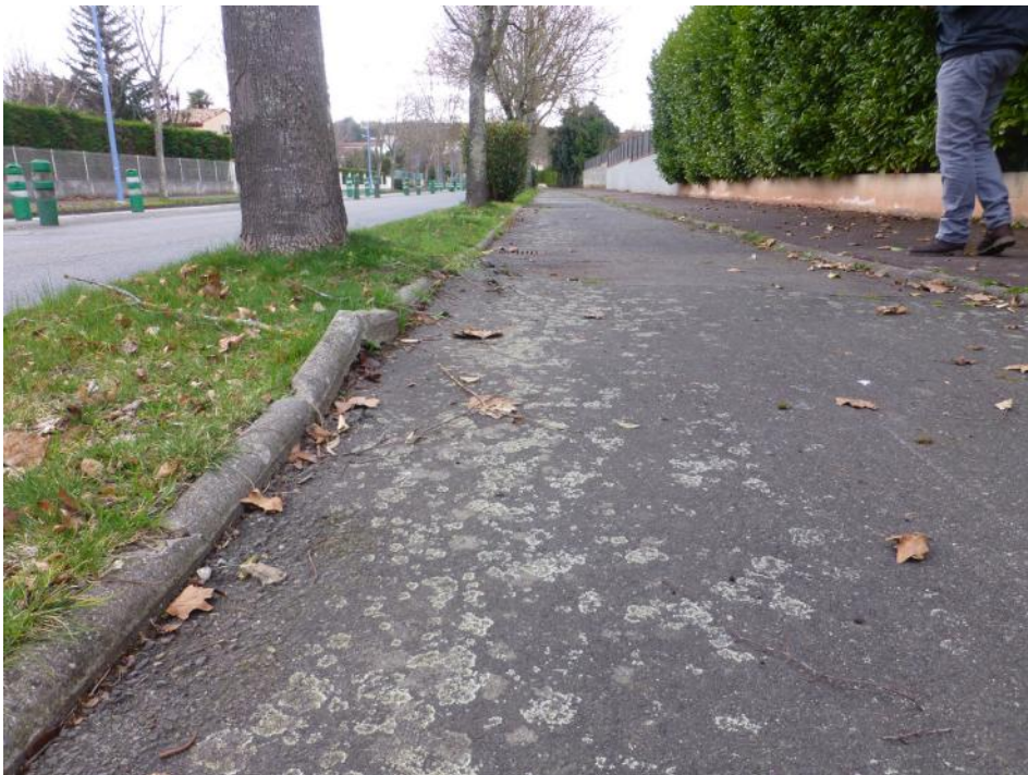
25-Déformation bordure et chaussée