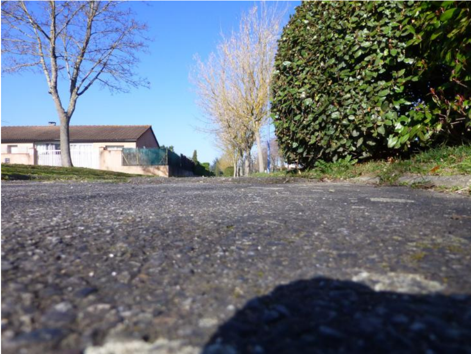
3- Sursaut racinaire