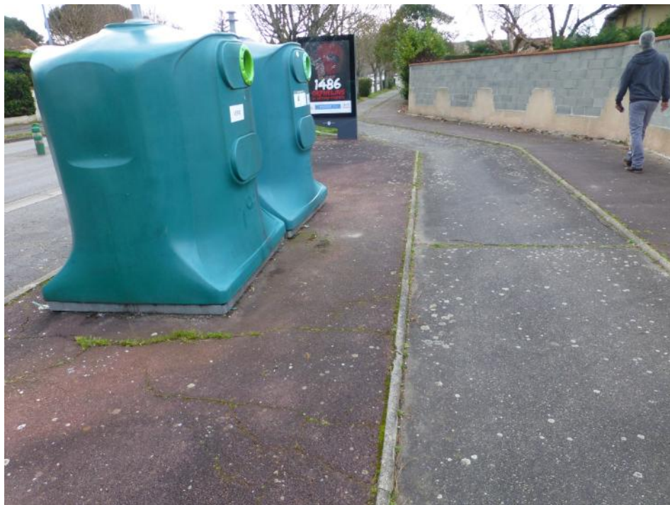
23-Des éclats de verre sur le sol, à nettoyer régulièrement