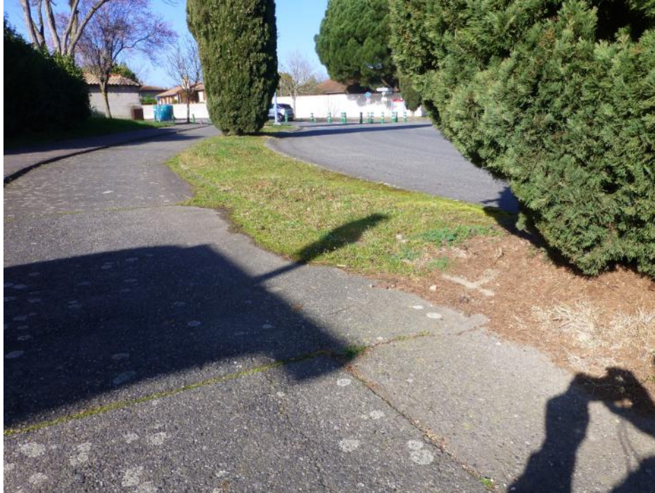
5-Amas d'herbe sur le coté