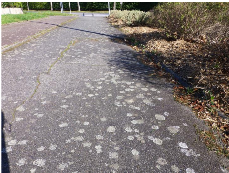
1-Affaissement de la chaussée